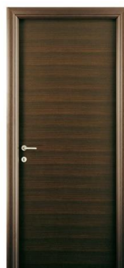
Mod.: 100 Finitura/Finish: Wenghè