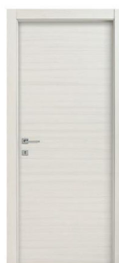
Mod.: 320 Finitura/Finish: Riso