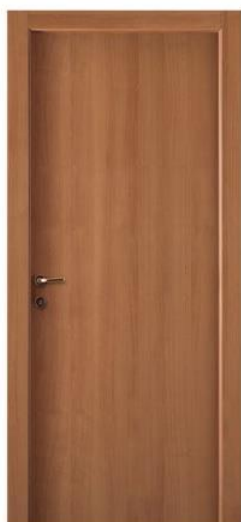
Mod.: 320 Finitura/Finish: Tanganika naturale