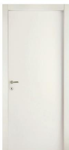
Mod.: 320 Finitura/Finish: Bianco Opaco

Le porte interne dei locali degli alloggi possono essere scelte dall'acquirente fra i seguenti modelli tamburato con impiallacciatura in melaminico con stipite rettangolare: