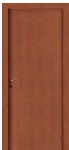
Mod.: 320 Finitura/Finish: Ciliegio