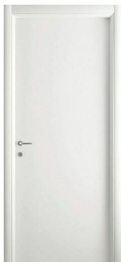
Mod.: 100 Finitura/Finish: Bianco Opaco

Porte di tipo tamburato con impiallacciatura in melaminico con stipse tondo: