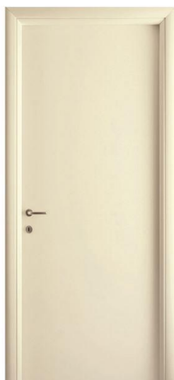
Mod.: 100 Finitura/Finish: Avorio Opaco