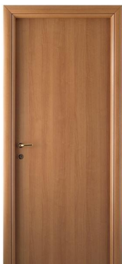
Mod.: 100 Finitura/Finish: Tanganika naturale