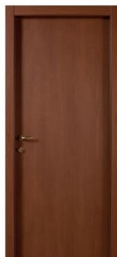
Mod.: 320 Finitura/Finish: Tanganika Noce

Porte di tipo tamburato con impiallacciatura in melaminico con stipse tondo: