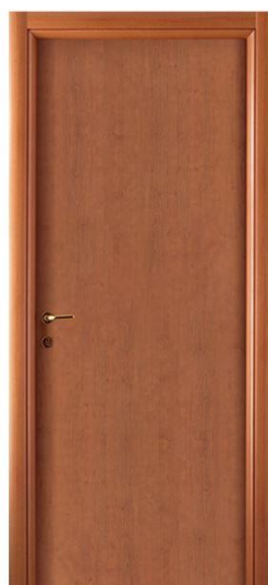
Mod.: 100 Finitura/Finish: Ciliegio