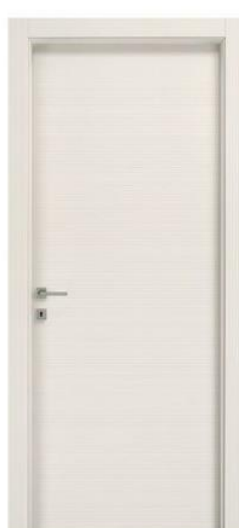
Mod.: 320 Finitura/Finish: Bianco Matrix