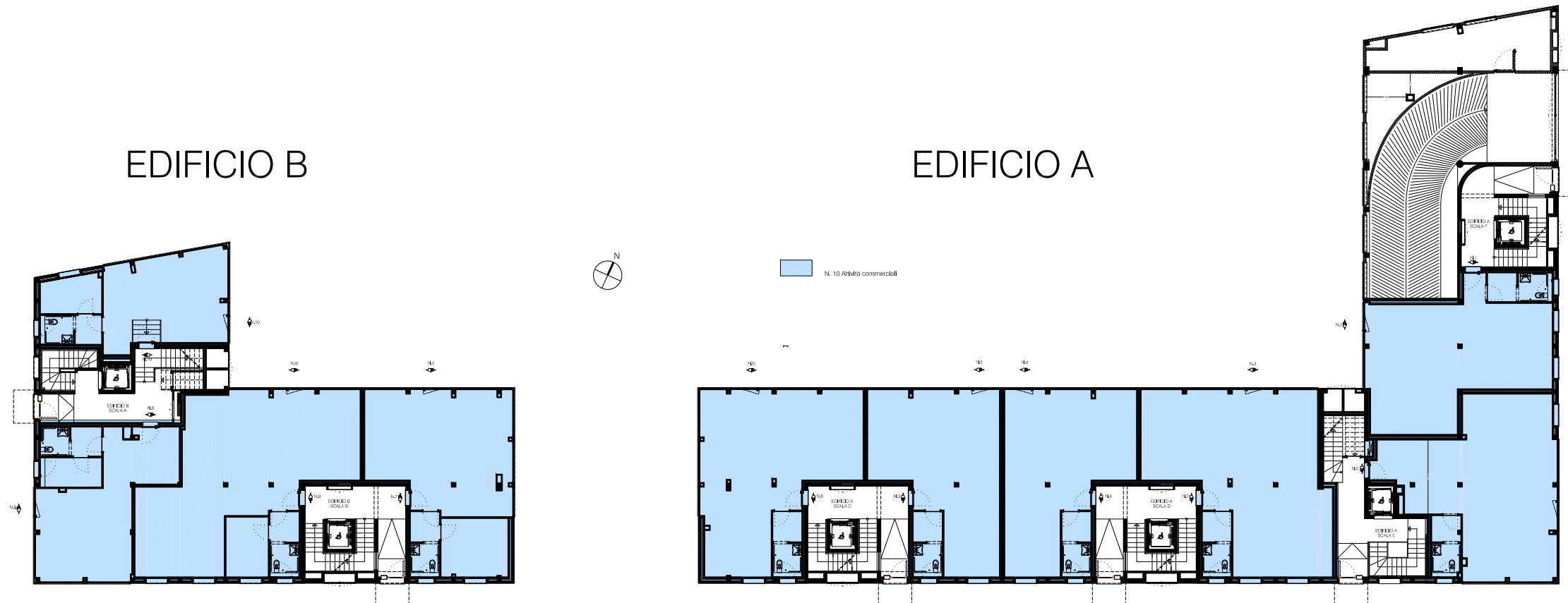
PIANTA PIANO TERRA EDIFICI A_B

DEVERO COSTRUZIONI SPA Strada provinciale per Villasanta, 17 20059 VIMERCATE (MI) Tel +39 039 661 4061 Fax +39 039 661 2154 www.deverocostruzioni.it